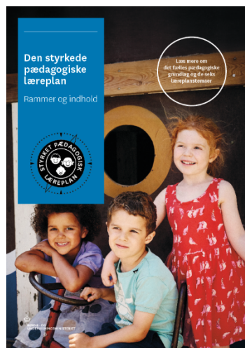
Den styrkede pædagogiske læreplan, Rammer og indhold

Dette dokument indeholder alle de lovmæssige krav til evalueringen.